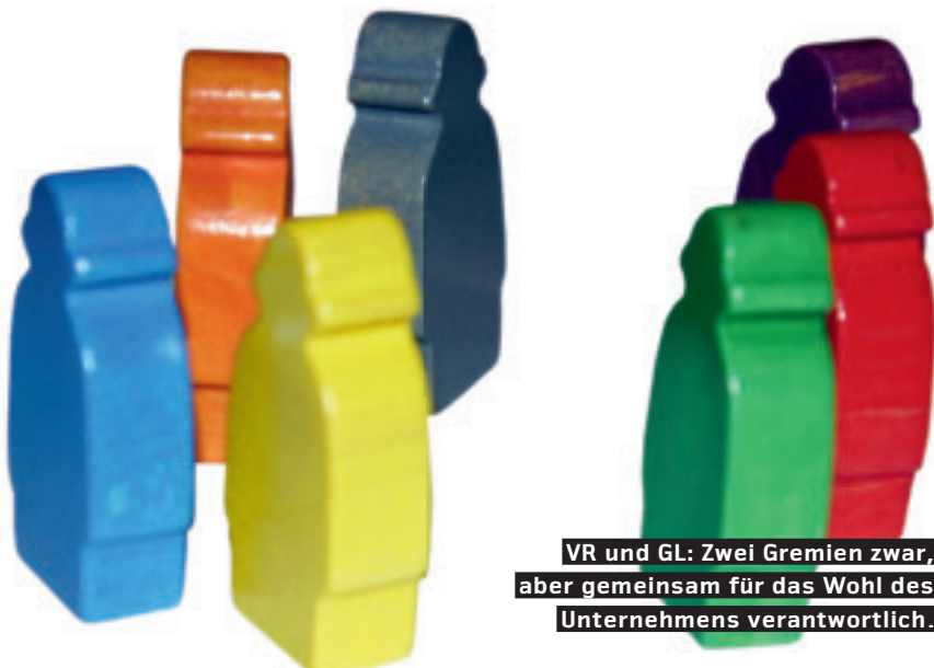
VR und GL: Zwei Gremien zwar, aber gemeinsam für das Wohl des Unternehmens verantwortlich.

Wir haben also gesehen, dass je nach Ausprägung der Zusammenarbeit entweder eine Schwächung (1+1=0,5) eintreten kann oder aber im positiven Fall ein erhebliche Stärkung durch die fruchtbare Art der Zusammenarbeit entsteht (1+1=3). Die Arbeit des VR hat nichts mit «verwalten» zu tun, sondern mit «gestalten». Die Zusammenarbeit zwischen VR und GL ist anspruchsvoll, da viel Fingerspitzengefühl dazugehört, einerseits der GL